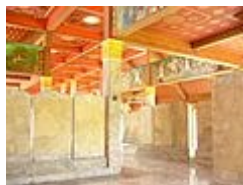
ภายในวิหารประดิษฐานพระไตรปิฎกหินอ่อน