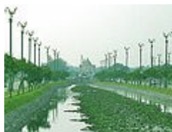
ถนนอุทยาน