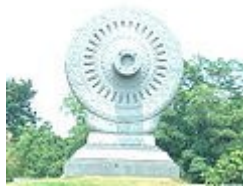
ธรรมจักรบริเวณส่วนสังเวชนียสถาน 4 ตำบล