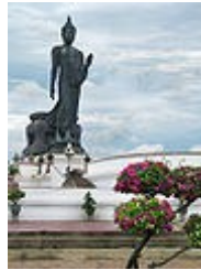
พระศรีศากยะทศพลญาณ ประธานพุทธมณฑล สุทรรศน์