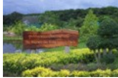
อุทยานแมลงเฉลิมพระเกียรติ