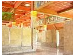
ภายในวิหารประดิษฐานพระไตรปิฎกหินอ่อน