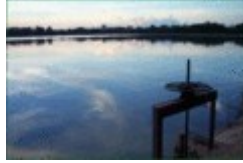
อ่างเก็บน้ำ (บ่อ ๑)